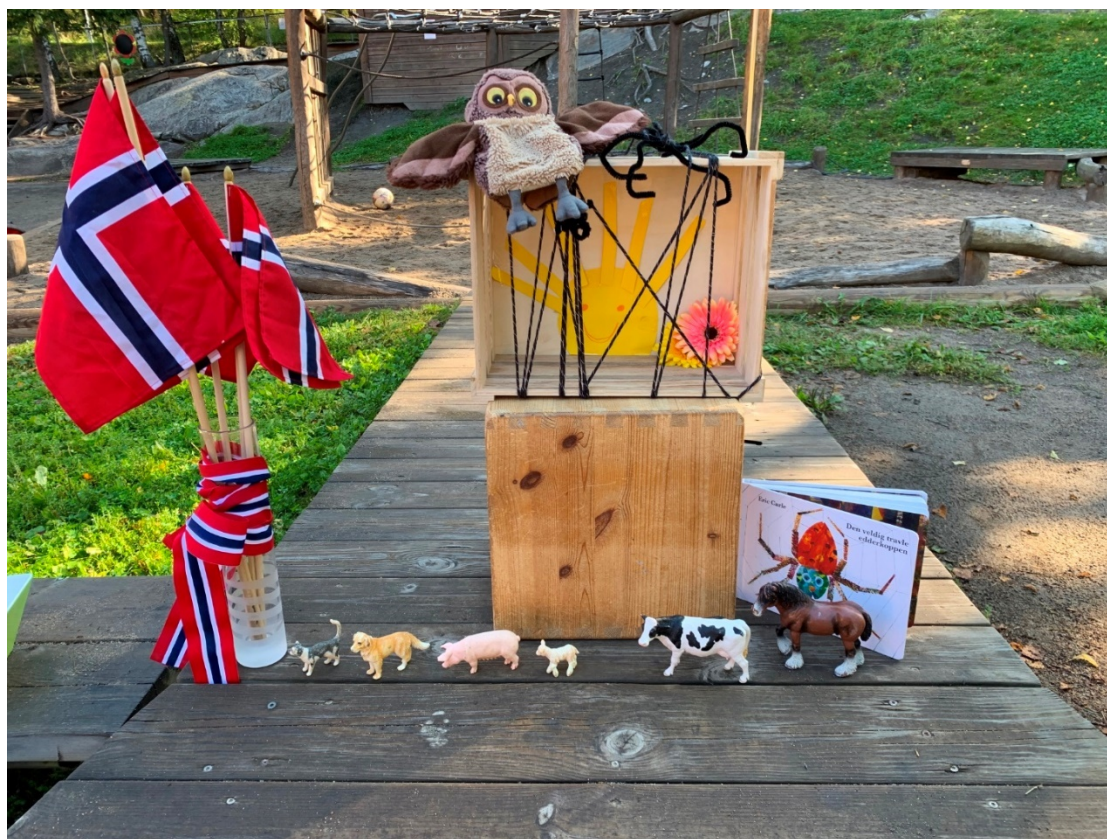
Forberedelse til en samlingsstund ute om Den travle edderkopp.

Foreldrerepresentantene/SU har ansvar for gjennomføring av 2 trivselsdugnader pr.år, 1 på våren og 1 på høsten. Dette er dugnader som skal sikre at utemiljøet ser og fungerer best mulig for barna deres. Dette er derfor arbeidstimer som kommer barna til gode. Det forventes at 1 fra hver husstand stiller på begge dugnadene. Datoene står i årets kalender, samt at dere får en påminnelse på Kidplan (vårt kommunikasjonsverktøy) når det nærmer seg.