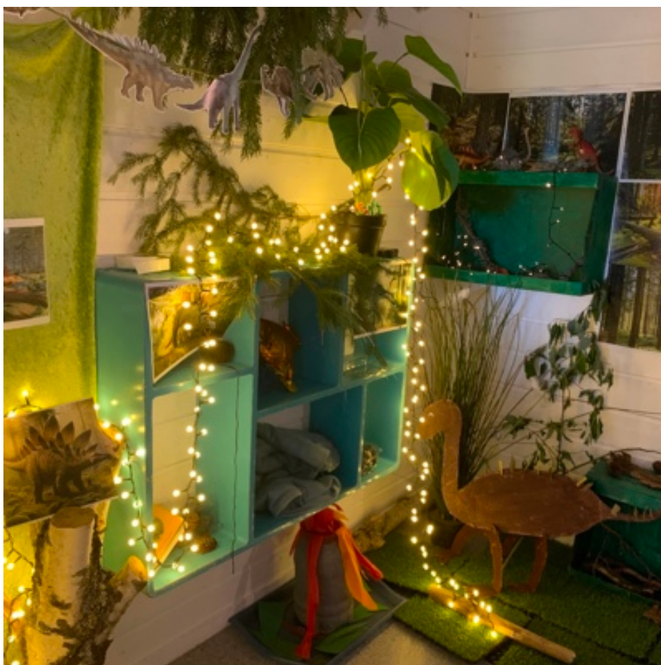
Bilde fra prosjektet vårt om dinosaurer, som ble startet og videreutviklet av interessen til barna.

«Hvis et barn skal kunne velge, må det kjenne mulighetene»