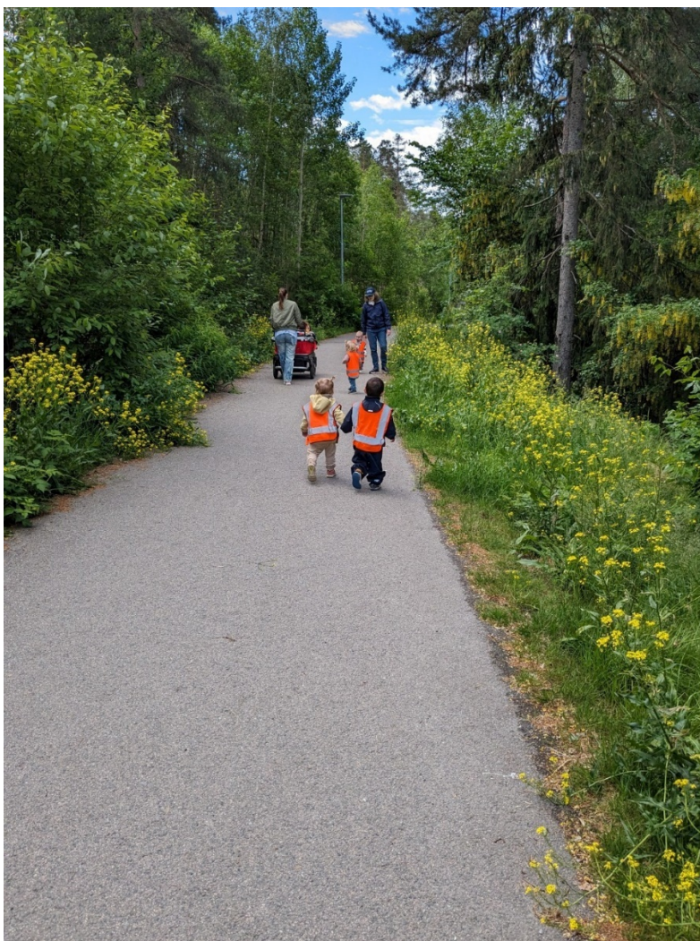
Det hjelper godt å ha en hånd å holde i på tur.

Personalet vil hjelpe og veilede barna så godt de kan, både med å få skiene av og på og med hvordan de kan komme seg opp dersom de faller.