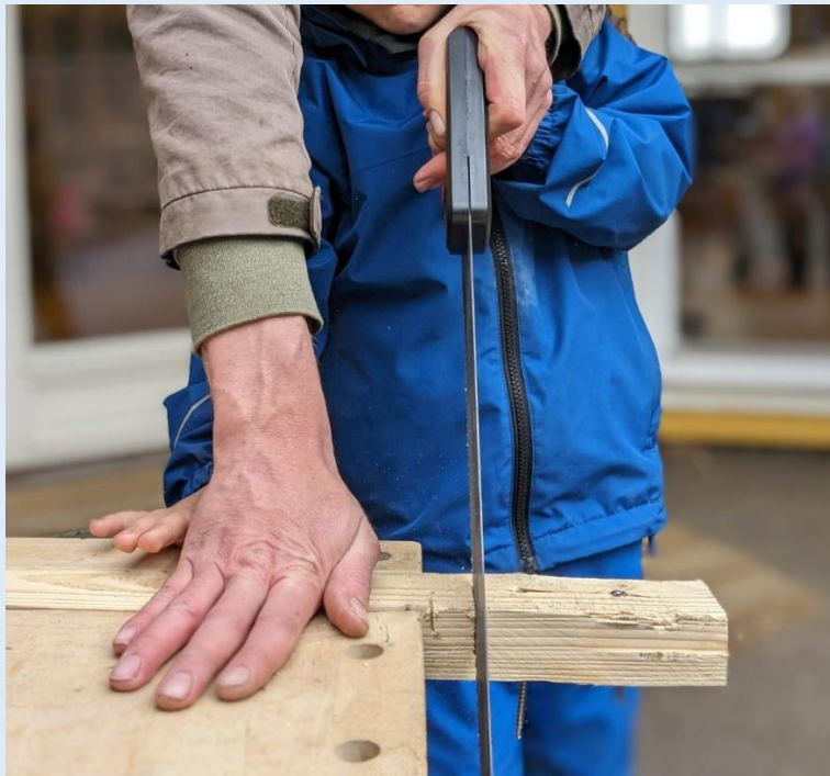
Veiledning fra en trygg og tilstedeværende voksen ved bruk av spennende verktøy.

I Solbakken skal alle voksne være gode rollemodeller og bidra til barnets helhetlige utvikling.